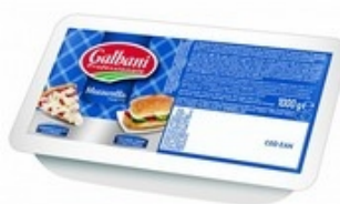
DUPONT Mozzarella blok/bloc 1 kg