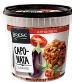
BRESC Caponata 1 kg