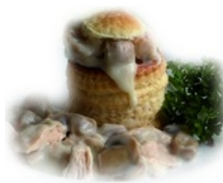
CUISINE MAISON Vol-au-vent met balletjes avec des boules 2,2 kg