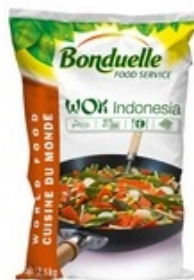
BONDUELLE Wok Indonesia 2,5 kg