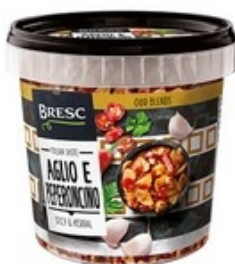
BRESC Aglio e peperoncino 1 kg