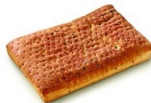
LANTERNA L43 Focaccia mediterranea 10x450 g