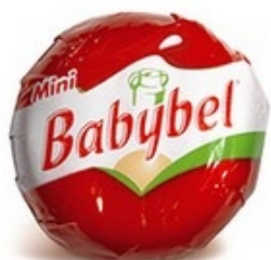
BABYBEL Mini babybel rood/rouge 96x22 g