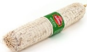
LACTALIS Galbani Salami Milano ±2,5 kg