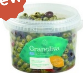
GRANOLIVA Olijvenmix apéro Mélange d'olives apéro 2,5 kg