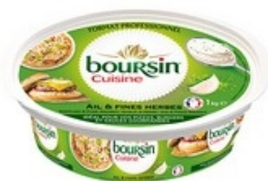
BOURSIN CUISINE Look & fijne kruiden Ail & fines herbes 1 kg