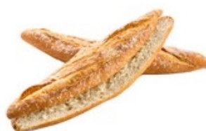
PANESCO 5000106 Barra gallega 45 cm 18x260 g