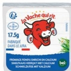
LA VACHE QUI RIT Natur porties Nature portions 17,5 g - 80 st/pcs