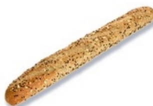
PASTRIDOR 224648 Stokbrood/Baguette fitness plus 57 cm - 23x320 g