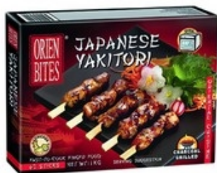
ORIEN BITES Japanese Yakitori Yakitori japonais 1 kg