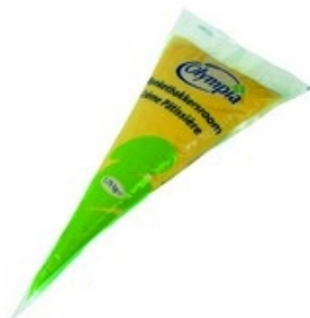
OLYPIA Banketbakkersroom Crème pâtissière 1,75 kg