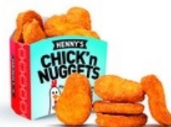
HENNY'S Chick'n nuggets 120 st/pcs 2,8 kg