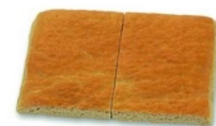
LANTERNA L42 Focaccia classica 10x450 g